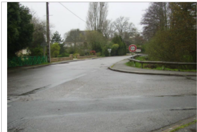
Rue de Tréalvé au-dessus du Gornay