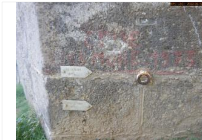
Vue du repère éloignée

SOURCE DE REPÉRAGE : SPC LACI, CAMPAGNE DE RECENSEMENT 2022 -