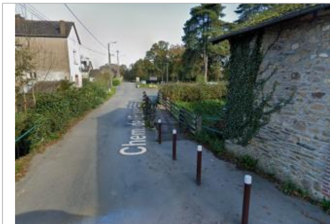
Rue de l'écluse - barrière sur le bras de décharge en novembre 2020