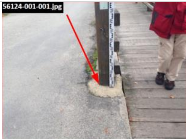
repère lors du nivellement en septembre 2015