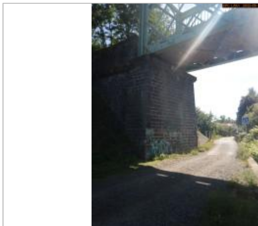
Vue du site éloignée (côté aval)