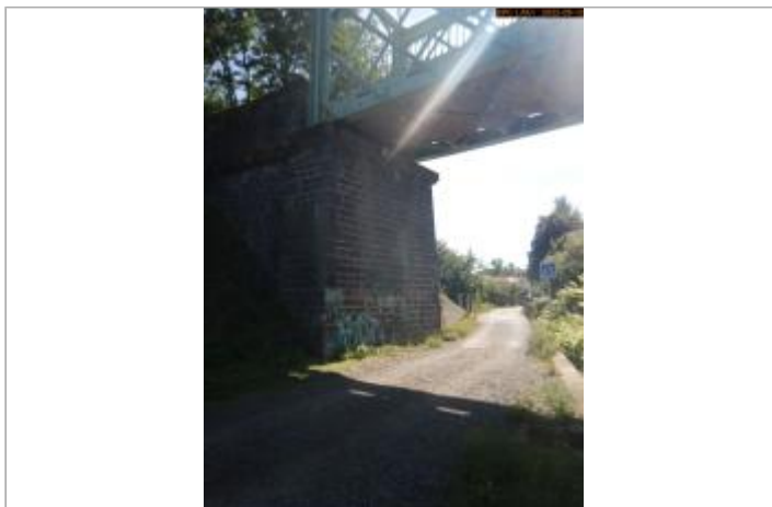
Vue du site éloignée (côté aval)