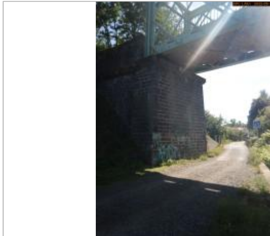
Vue du site éloignée (côté aval)