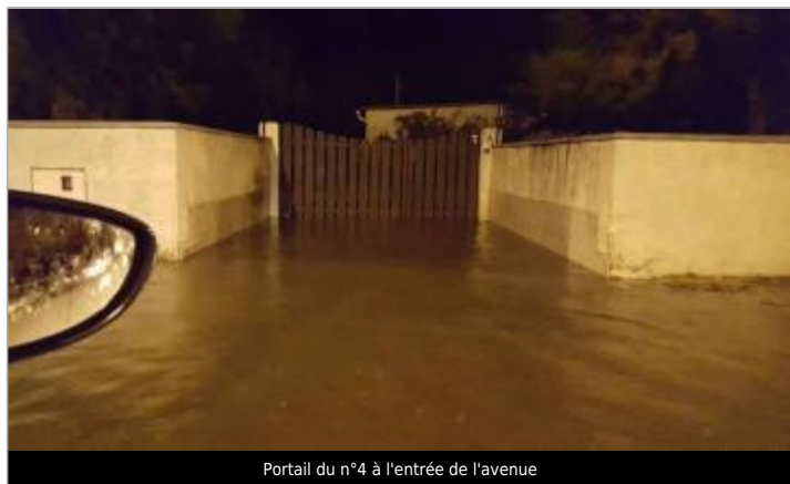
Portail du n°4 à l'entrée de l'avenue

Altitude calculée de l'eau (en m) : 0.7 m