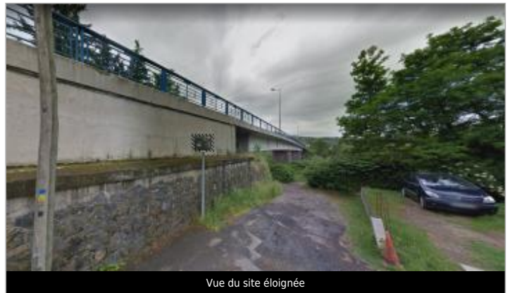
Vue du site éloignée