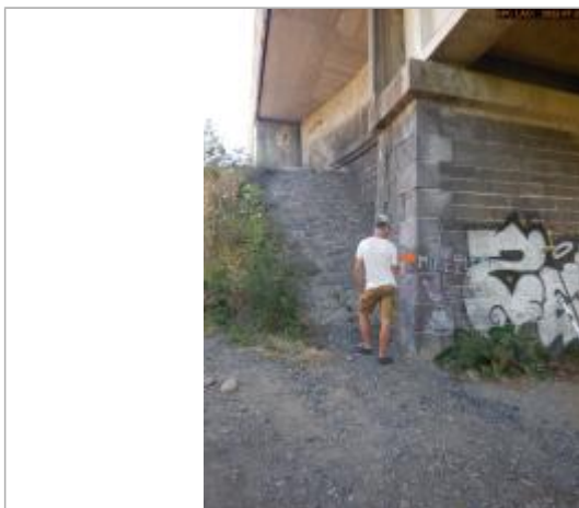
Vue du repère éloignée

Altitude calculée de l'eau (en m) : 330.775 m