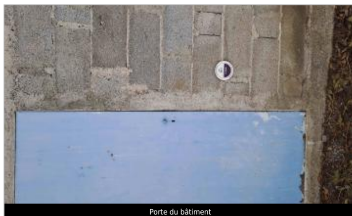
Porte du bâtiment