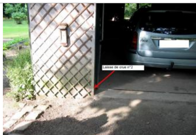
Photo du repère lors du relevé en 2004