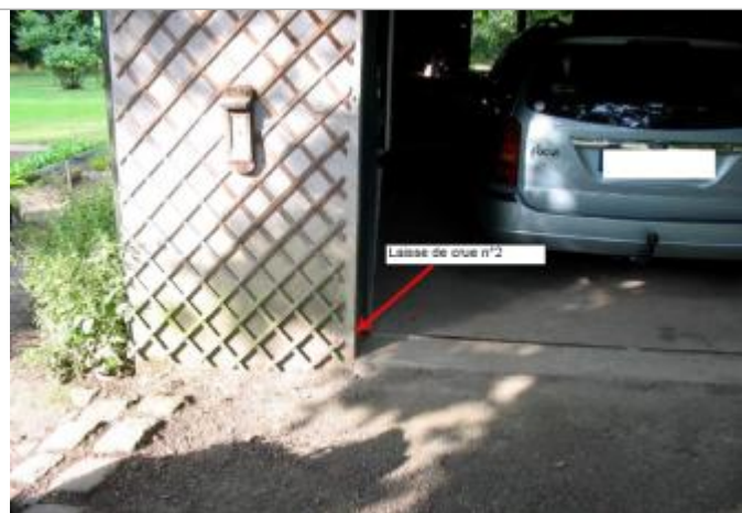
Photo du repère lors du relevé en 2004

Altitude calculée de l'eau (en m) : 66.641