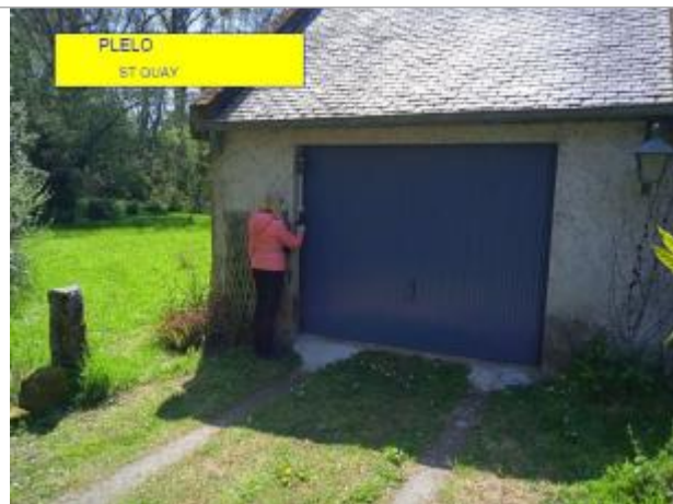
Photo du site lors du nivellement en 2022