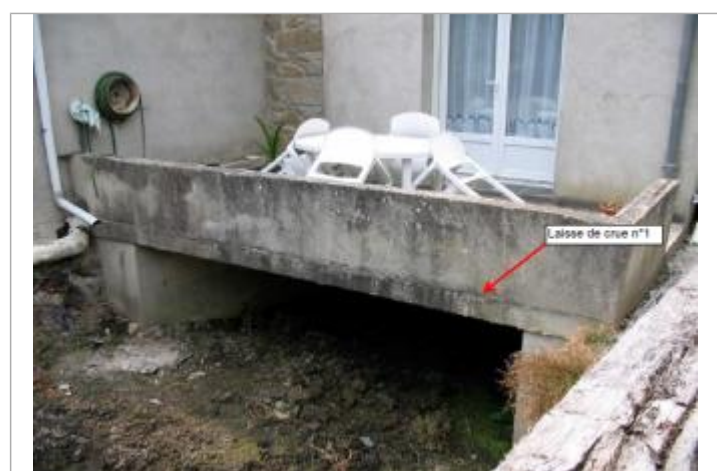
Photo du repère lors du relevé en 2004

GÉNÉRAL Code : SPC_22206_AZI_1_1999 Date de mise à jour : 24/11/2022 Auteur : SPC VCB