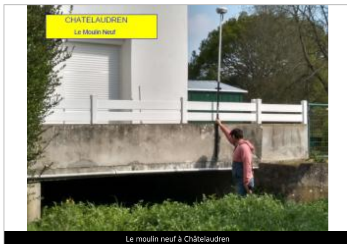
Le moulin neuf à Châtelaudren

GÉOLOCALISATION Coordonnées WGS84 : X: -2.97712653 / Y: 48.54789700 Coordonnées RGF93 (Lambert 93) X: 259259.03 / Y: 6844207.74 Coordonnées RGF93 (ETRS89) : X: -2.9771265 / Y: 48.547897 Code Hydro: Q0000630 Rive de référence: Droite