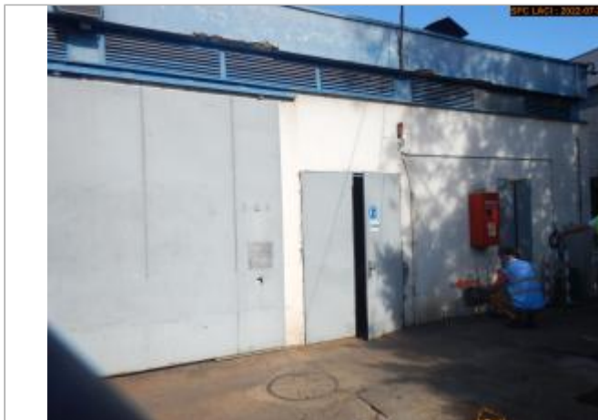
Vue du site éloignée (Bâtiment)