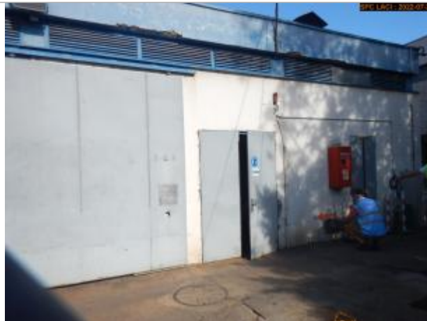
Vue du site éloignée (Bâtiment)