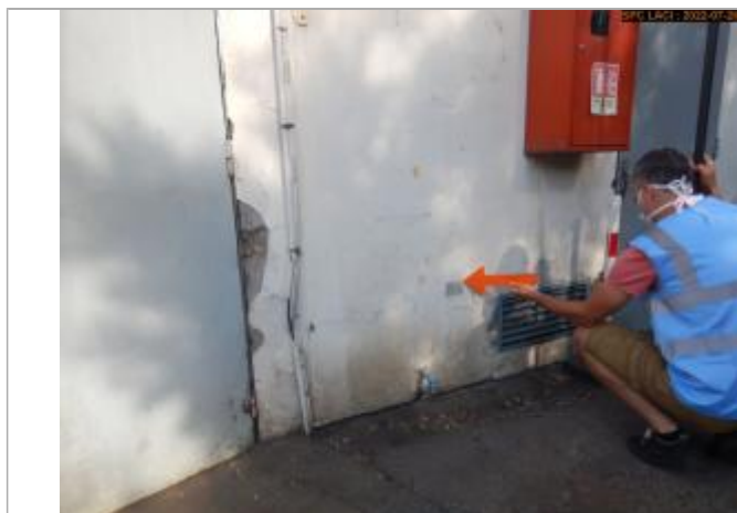
Vue du repère éloignée (Bâtiment)