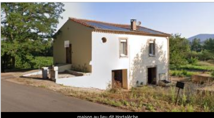
maison au lieu dit Hortalèche