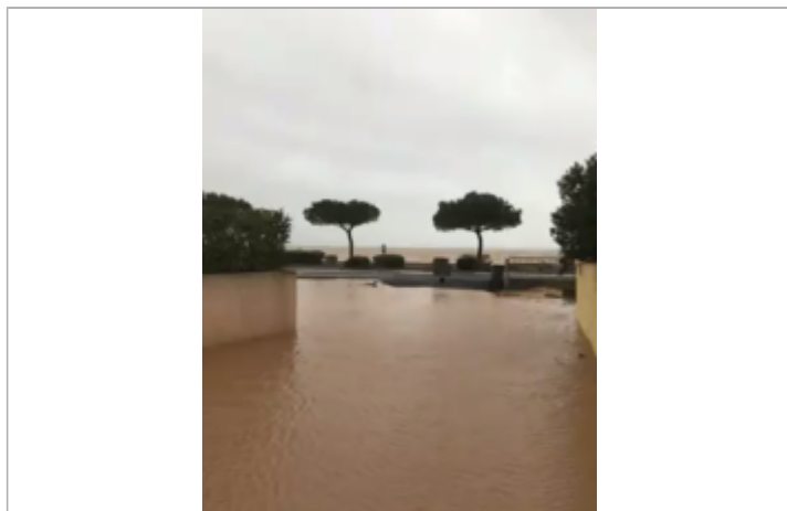
Embouchure de la rue sur la promenade

Altitude calculée de l'eau (en m) : 1.2 m