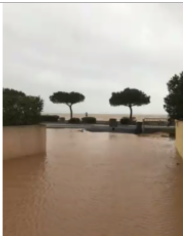
Embouchure de la rue sur la promenade

Altitude calculée de l'eau (en m) : 1.2 m