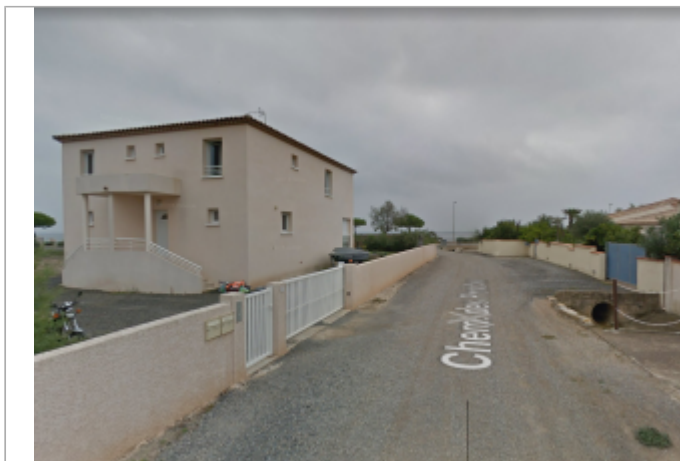
Partie basse du chemin qui donne sur la promenade