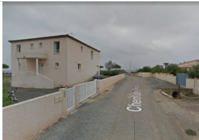
Partie basse du chemin qui donne sur la promenade