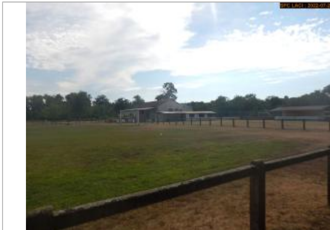
Vue du site éloignée

Coordonnées WGS84 : X: 3.33509052 / Y: 45.40077417