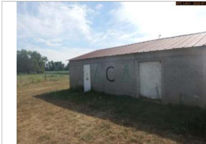
Vue du site (côté extérieur)