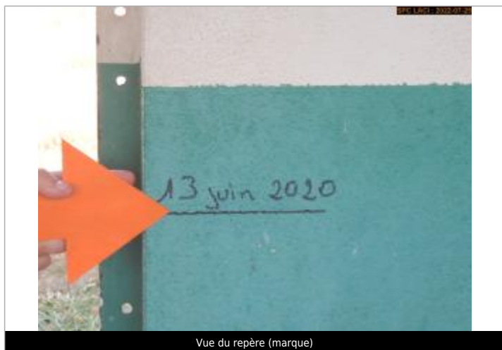
Vue du repère (marque)