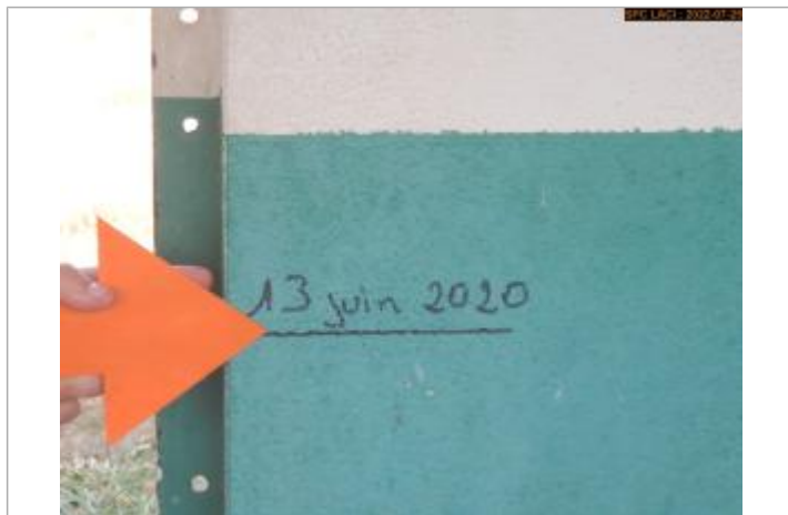
Vue du repère (marque)