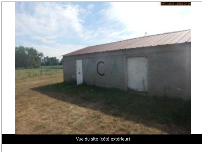
Vue du site (côté extérieur)