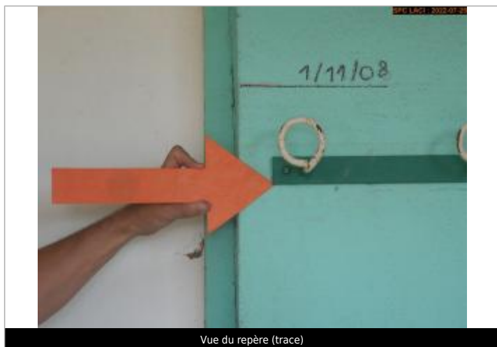
Vue du repère (trace)