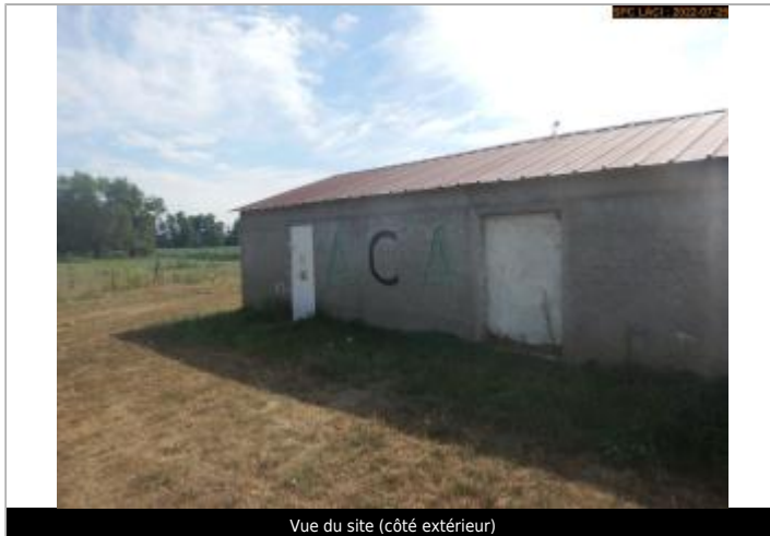
Vue du site (côté extérieur)