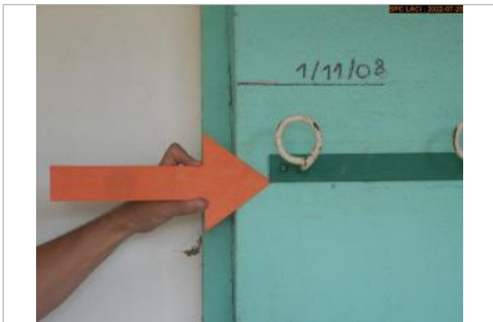
Vue du repère (trace)