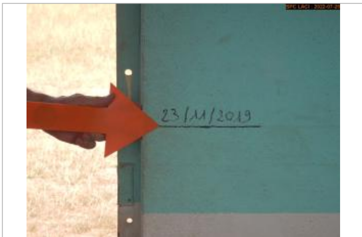
Vue du repère (marque+trace)