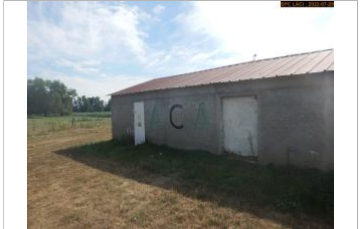
Vue du site (côté extérieur)