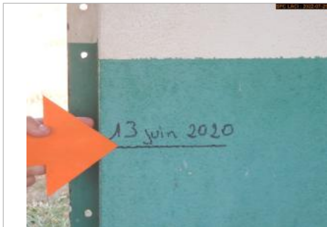
Vue du repère (marque)