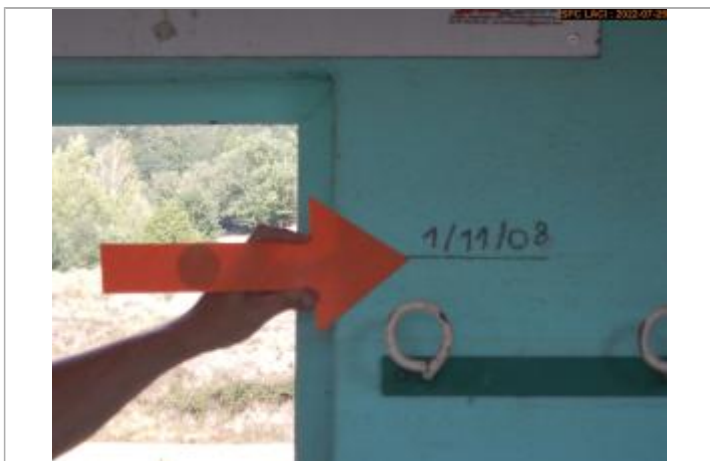
Vue du repère (marque)