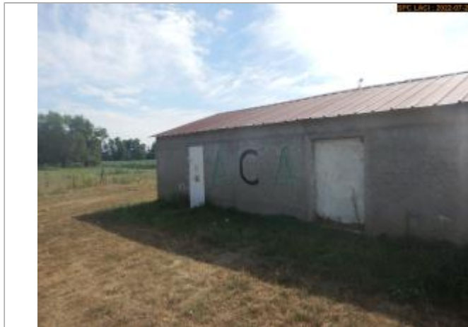
Vue du site (côté extérieur)

Coordonnées WGS84 : X: 3.36477737 / Y: 45.37552795