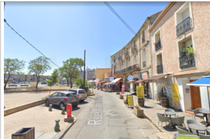
Rue Maurice Clavel en direction de la place du Mail