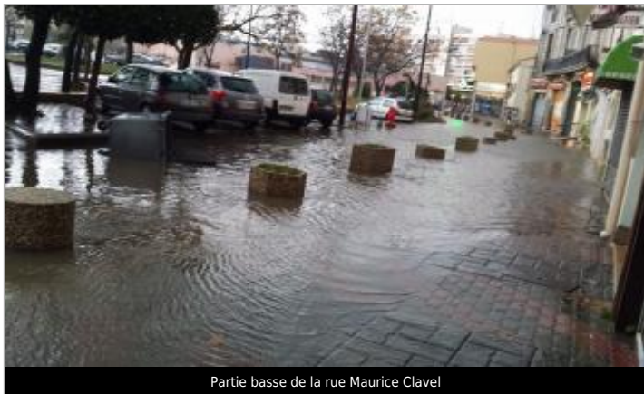
Partie basse de la rue Maurice Clavel