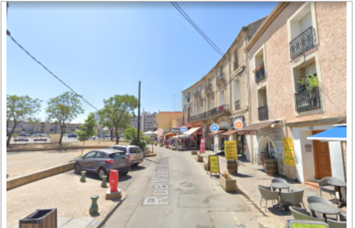
Rue Maurice Clavel en direction de la place du Mail