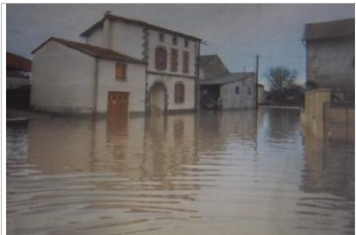
Vue du site pendant la crue de 2003