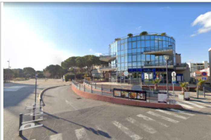
La grille d'évacuation des eaux est située sous le muret de la rampe d'accès