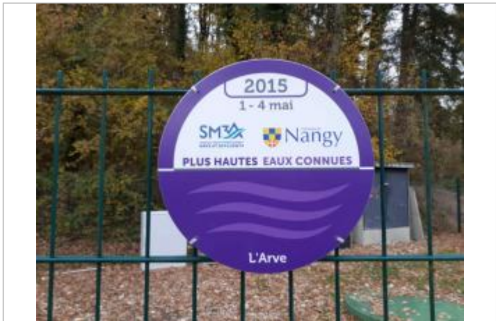
Crue de l'Arve mai 2015

MARQUE Texte : Crue de l'Arve en mai 2015 Maximum de l'inondation : Oui Visibilité : Oui État du repère : Bon Pérennité : Longue Repère calculé : Non PHEC : Oui