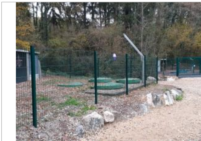
chemin des bois