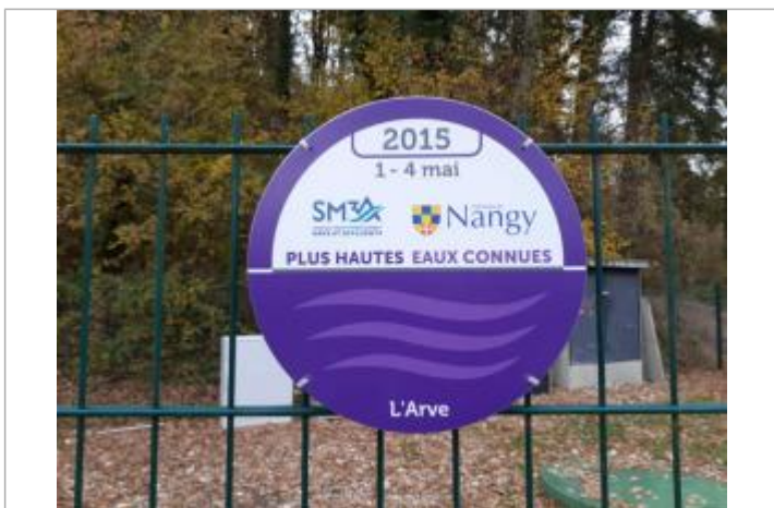
Crue de l'Arve mai 2015

Texte : Crue de l'Arve en mai 2015 Maximum de l'inondation : Oui Visibilité : Oui État du repère : Bon Pérennité : Longue Repère calculé : Non PHEC : Oui