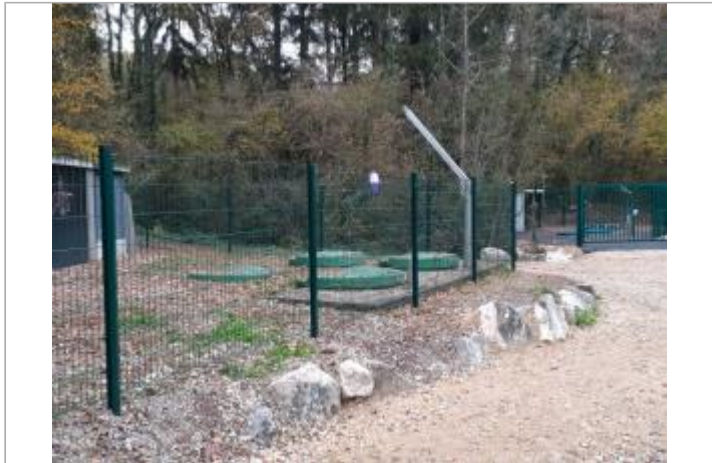
chemin des bois