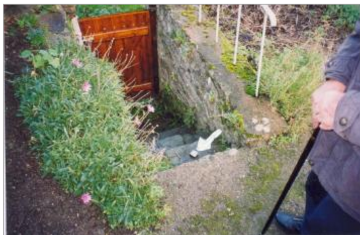
Photo du repère en 2004 lors du relevé

Altitude calculée de l'eau (en m) : 6.5 m