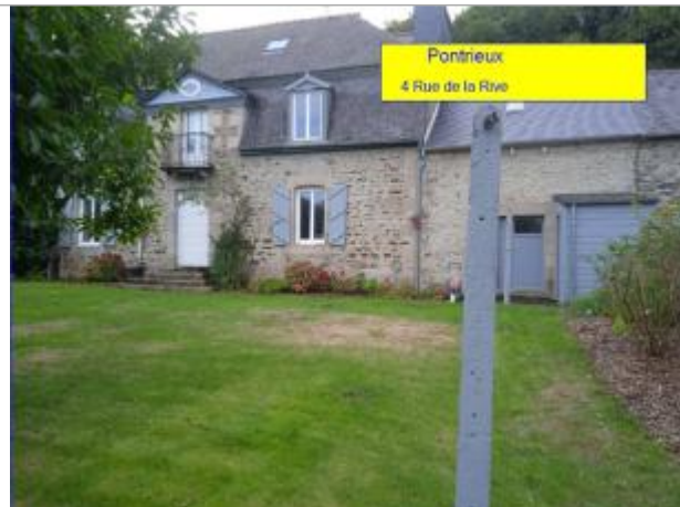
Maison et jardin au 4 rue de la rive à Pontrieux