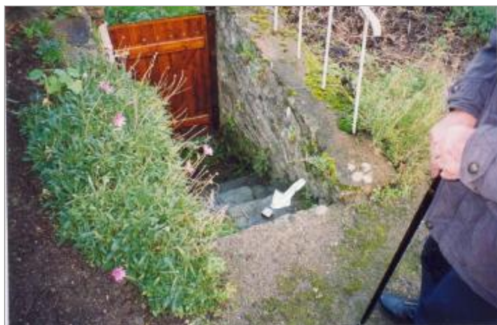
Photo du repère en 2004 lors du relevé