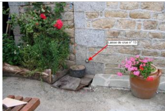
Maison près du Trieux au moulin neuf en 2004