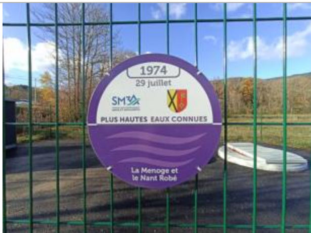
crue de la Menoge et du Nant Robé en 1974