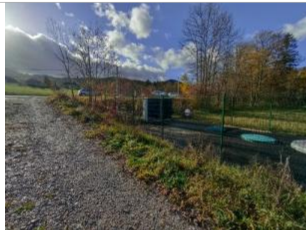
poste de refoulement vers ancienne ferme