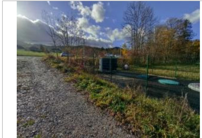
poste de refoulement vers ancienne ferme