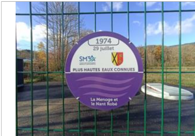
crue de la Menoge et du Nant Robé en 1974