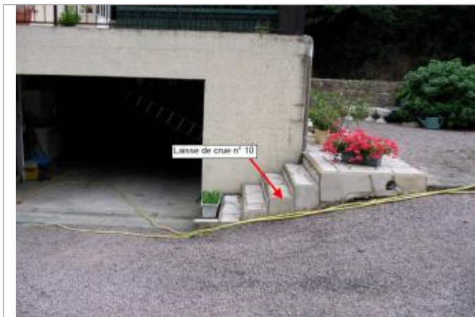
Maison à Roudedou en Ploumagoar en 2004

Coordonnées WGS84 : X: -3.15049547 / Y: 48.54606750