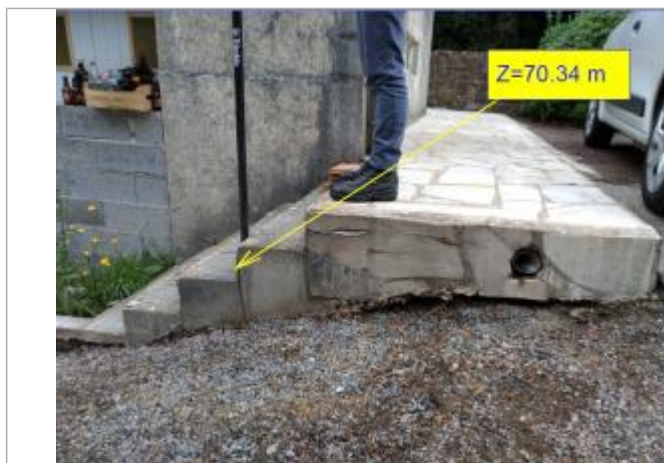
3ème marche en partant du bas lors du nivellement en 2022