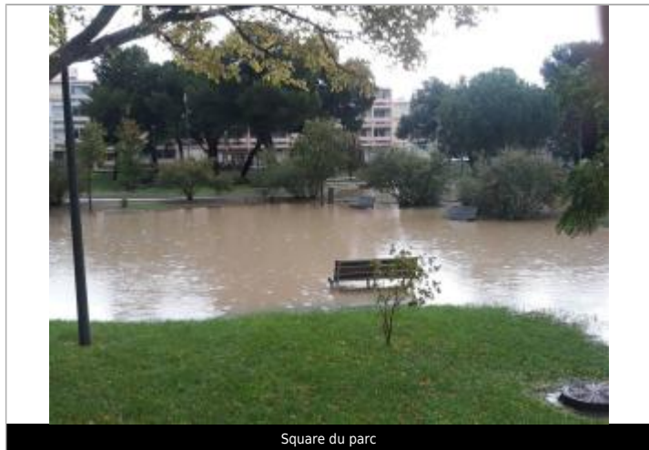
Square du parc

Altitude calculée de l'eau (en m) : 1.7 m