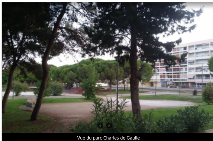
Vue du parc Charles de Gaulle